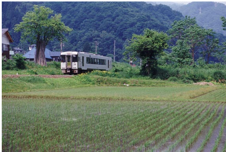
(JR 飯山線 西大滝～信濃白鳥)

Shinsyu Rail View ～信州の鉄道風景～ 2004 Calendar 紅色の道