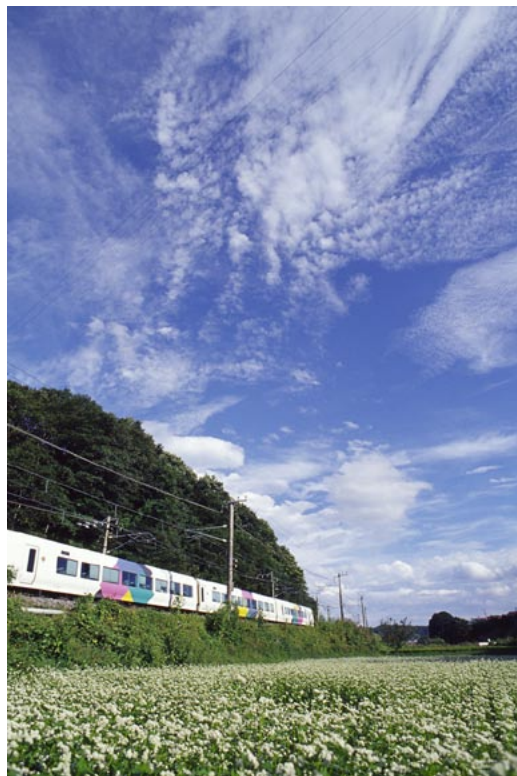
（JR中央東線 すずらんの里く青柳）

Shinsyu Rail View ～信州の鉄道風景～ 2004 Calendar 紅色の道