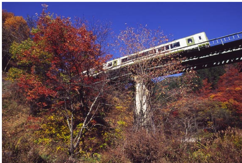
(JR 小海線 佐久広瀬～佐久海ノ口)

Shinsyu Rail View ～信州の鉄道風景～ 2004 Calendar 紅色の道