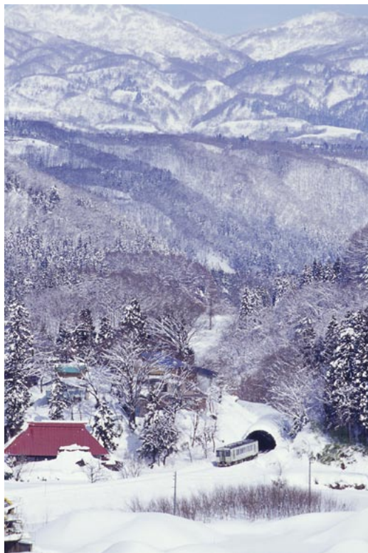
(JR飯山線 上境〜上桑名川)

Shinsyu Rail View ~信州の鉄道風景~ 2004 Calendar 紅色の道