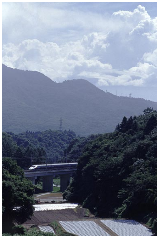
（長野新幹線 軽井沢～佐久平）

Shinsyu Rail View ～信州の鉄道風景～ 2004 Calendar 紅色の道