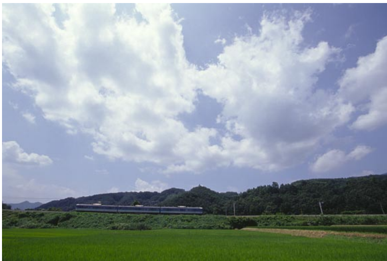
(JR 篠ノ井線 坂北～聖高原)

あの彼方へ 見上げると 空は無限に広がっていました 僕はここにいます きつと届く 必ず届く