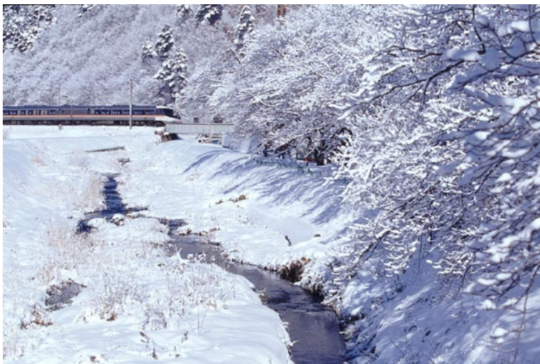
(JR 篠ノ井線 聖高原～冠着)

白い花を手にとると 数える間もなく 手の中に消えていきました 静かに身を隠すように また会えますよね