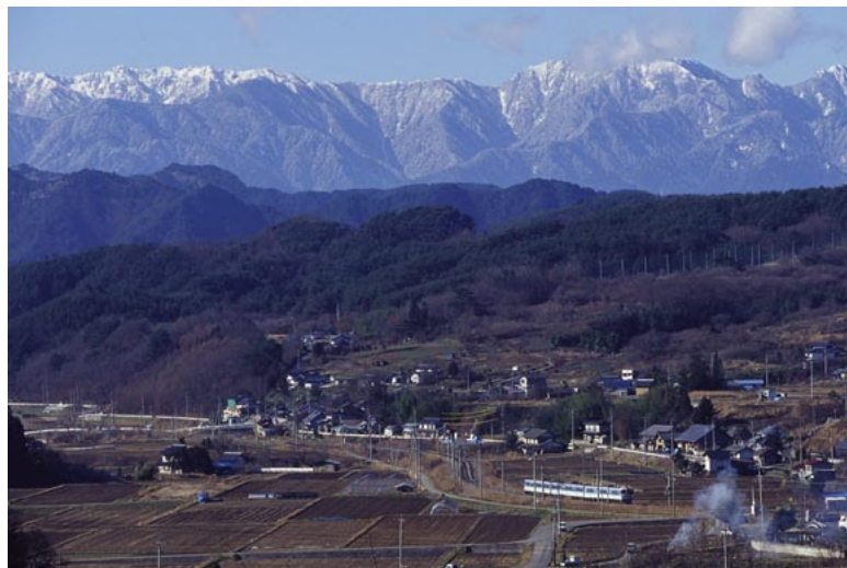
(JR 篠ノ井線 坂北～聖高原)

Shinsyu Rail View ～信州の鉄道風景～ 2004 Calendar 紅色の道