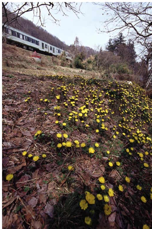
（JR 飯山線 蓮ヶ飯山）

Shinsyu Rail View ～信州の鉄道風景～ 2004 Calendar 紅色の道