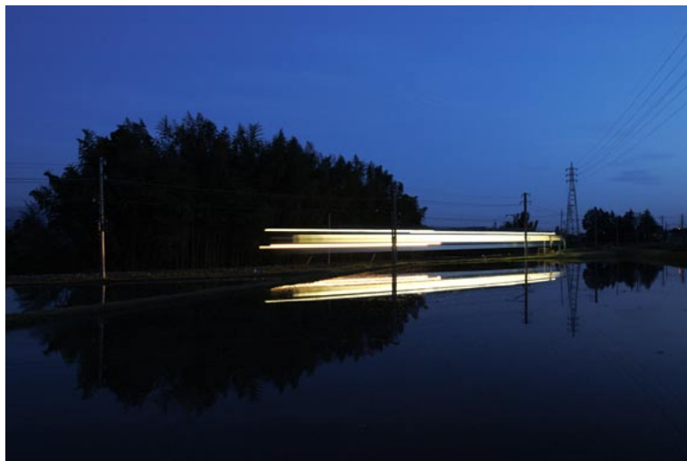
(JR 飯田線 七久保～伊那本郷)

Shinsyu Rail View ～信州の鉄道風景～ 2004 Calendar 紅色の道